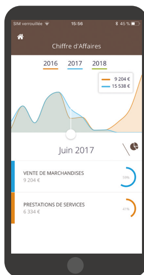
Aperçu en version mobile